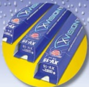
PALHETAS PARA LIMPADORES DE PÁRA-BRISAS